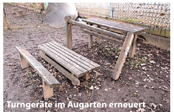
Turngeräte im Augarten erneuert