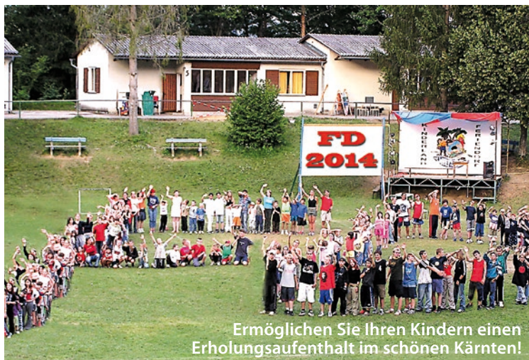
Ermöglichen Sie Ihren Kindern einen Erholungsaufenthalt im schönen Kärnten!

„Erholungsaufenthalte sollten allen Kindern, unabhängig von der Größe der Brieftasche ihrer Eltern, zugänglich sein“, betont Piech. Deshalb nimmt man sich bei Kinderland Steiermark Zeit, um Eltern von Kindern, die an einer Ferienaktion teilnehmen möchten, möglichst gut zu beraten, damit sie eine Unterstützung, die ihnen zusteht, auch bekommen.