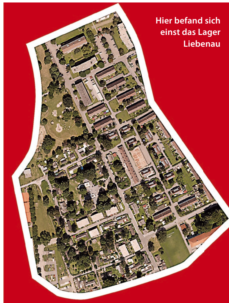
Hier befand sich einst das Lager Liebenau