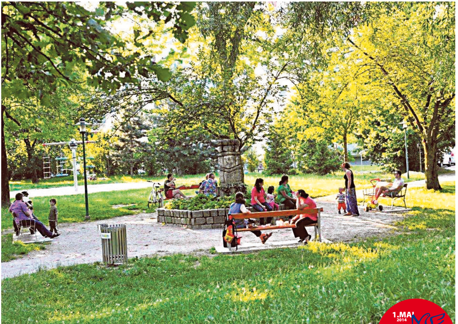
Diese Bankerl im Johannespark wurden im Rahmen der Aktion „Geld für Bankerl statt für Banken“ aufgestellt.