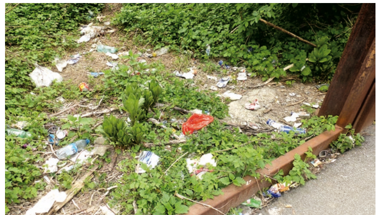
Manche Grundstücksbesitzer kümmern sich nicht um ihr Eigentum.

Wenn sich viele Grazer über verschmutzte Gehwege, Plätze oder Grünflächen beklagen, darf man eines nicht vergessen: Auch wenn sich die Holding Graz bemüht, die Stadt Graz sauber zu halten, gibt es viele Flächen, für die nicht die Holding zuständig ist, sondern die jeweiligen Grundstücksbesitzer.