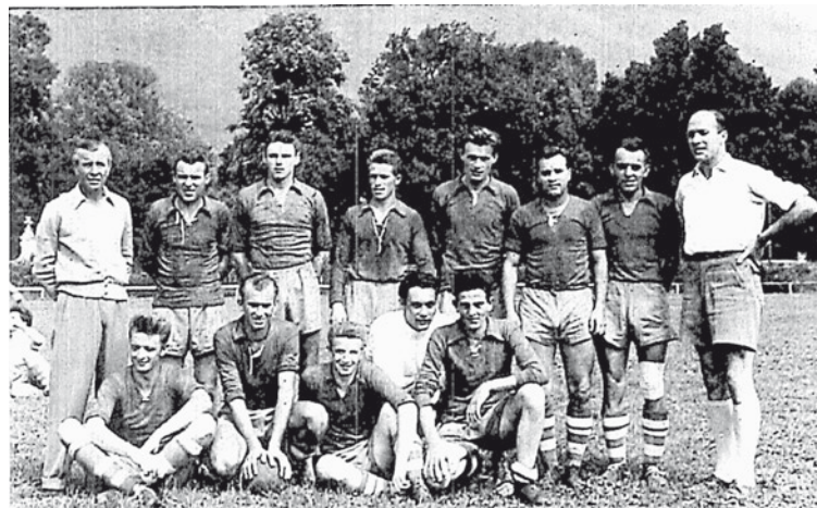
Die ungeschlagene Post-Elf im letzten Meisterschaftsspiel 1953/54.

Ihr allererstes Match bestritten die Postler im Juni gegen die Eisenbahner vom SV Heizhaus. Ursprünglich nur Post- und Telegrafendiensteten zugänglich wurde der Verein sukzessive geöffnet und bald in „Union Graz“ umbenannt. Rasch