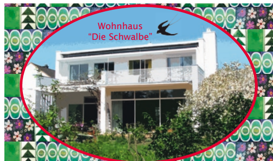
Wohnhaus „Die Schwalbe“

Der Verein „Die Schwalbe“ begleitet Frauen, die wegen einer psychischen Krise oder schwierigen Lebenssituation vorübergehend nicht alleine wohnen können oder wollen.