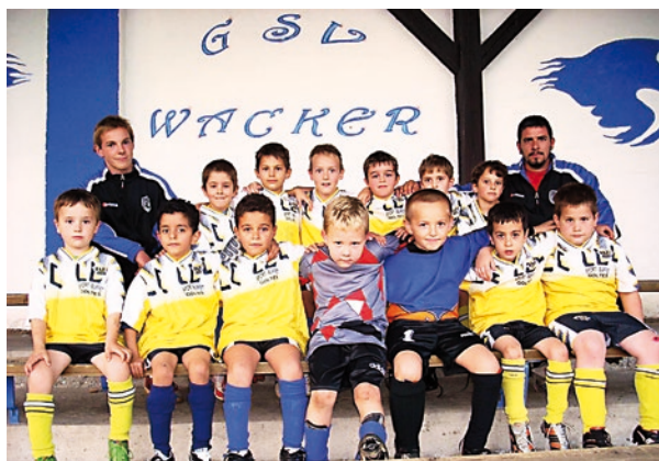
Die Nachwuchsarbeit steht bei der GSV Wacker im Mittelpunkt. Mehr als 100 Kinder und Jugendliche kicken am Körnerplatz in der Hüttenbrennergasse.

Mehr als 100 Kinder, vor allem aus der unmittelbaren Umgebung, kicken heute in sechs Jugendteams von der U9 bis zur U15 am Körnerplatz. Die vorbildliche Jugendarbeit des Traditionsvereins hat großartige Spieler hervorgebracht – etwa Christian Klem und Valentino Lazaro, auch Mario Haas kickte als Kind am Körnerplatz. „Für die Kinder und Jugendlichen des Schönau-Viertels wäre das Aus der GSV Wacker