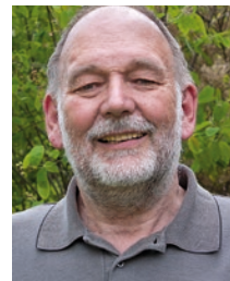
von Dr. Rainer Possert

Der von den Nazis nachweislich zugeschüttete Bombentrichter beim Kindergarten wird überbaut. Zahlreiche andere, auf Luftaufnahmen sichtbare Bombentrichter, Gruben und Erdanhäufungen werden unsichtbar gemacht.