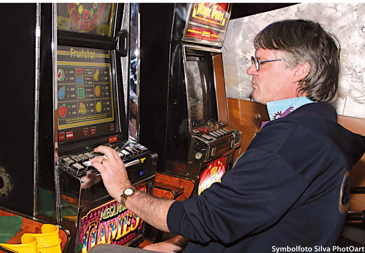
Symbolfoto Silva PhotOart

Liebe Spieler, wenn ihr spielsüchtig seid: hört auf bevor es zu spät ist, denn die Automaten zerstören dein Leben und die Existenz deiner Familie. Denn wenn es zu spät ist hilft dir finanziell keiner. Wie heißt es im Spiel, wenn nichts mehr geht: „Game over“