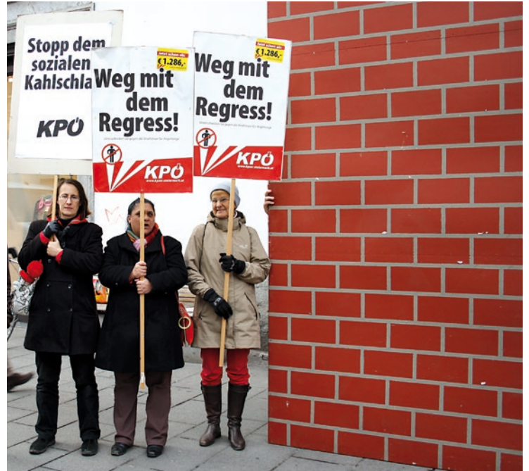
Die Mauer wächst bei jeder Landtagsitzung. KPÖ gibt nicht nach im Kampf gegen den ungerechten Regress.