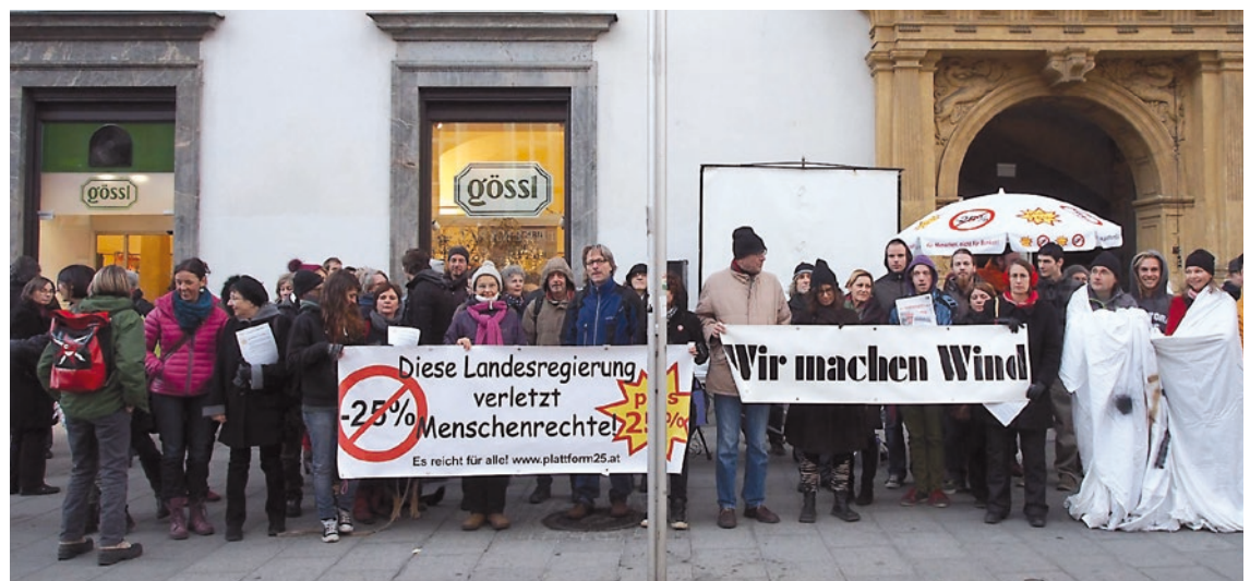
Kündigung der-alpha-nova Leistungen: Angehörige sind geschockt.