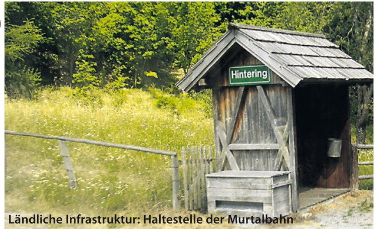
Ländliche Infrastruktur: Haltestelle der Murtalbahn

vor, wie sie sich eine Sanierung der Landesfinanzen und die Entwicklung des ländlichen Raumes vorstellen: Kürzen, Streichen, Zusperrn, lautet dabei ihr Motto. Hat sich gerade die steirische