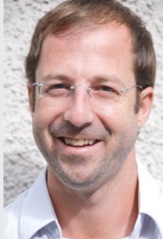
Von Philipp Reiningger

Die „Vereinheitlichung“ der Gebühren - Anmerkung: Vereinheitlichung heißt hier natürlich in den meisten Fällen eine massive Erhöhung – darf ja „nur“ 20% pro Jahr(!) betragen – lässt weiterhin auf sich warten, in vielen Gemeinden wurde damit noch nicht einmal begonnen. Die Konsequenz wird eine massive Erhöhung, aufgeteilt auf wenige Jahre, sein. Den durchschnittlichen Bürger wird dies vielleicht ärgern, eine Mindest-