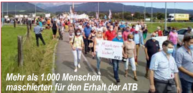
Mehr als 1.000 Menschen marschierten für den Erhalt der ATB

Die industriellen Kernelemente in unserer Region sind im wesentlichen die Holz- und holzverarbeitende Industrie, die Stahlveredelung, Stahlverarbeitung, Maschinenbauindustrie, Zellstoff und Papierindustrie und rund um die ATB eine Elektroindustrie.