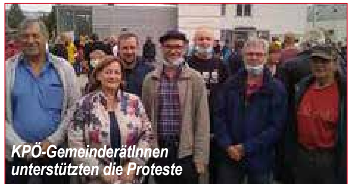
KPÖ-GemeinderätInnen unterstützten die Proteste

Zuerst wurden öffentliche Förderungen kassiert, dann wurde der Betrieb ausgepresst, Forschung und Entwicklung vernachlässigt. Selten wurden neue Investitionen getätigt. Um den Profit zu maximieren wurden Lohnverzicht und der Verzicht auf bezahlte Pausen durchgesetzt und die Antreiberei verstärkt.