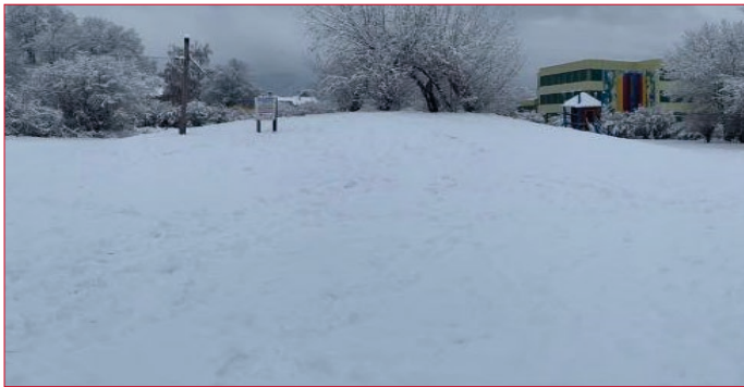
Diese schöne Freifläche in der Dienesgasse soll mit Eigentumswohnungen verbaut werden.

Die Diskussion um das aufs Eis gelegte Bauprojekt in der Parkstraße und das aktuelle Bauvorhaben in der Dienesgasse zeigen: Grünflächen in Wohnnähe sind ein wichtiger Teil der Lebensqualität. Darauf wollen den viele Menschen zu Recht nicht verzichten. Angesichts des Klimawandels und ausufernder Bodenversiegelung ist jede freie Fläche als wertvolles Gut zu beachten, das es wert ist zu schützen.