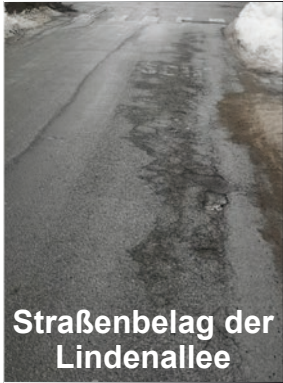
Straßenbelag der Lindenallee

Die Auslagerung von Personal halten wir für eine Fehlentwicklung. Die KPÖ schlägt seit längerem vor durch die öffentliche Hand einen Pool an SpringerInnen im Kindergartenbereich zu schaffen, um nicht von Privaten abhängig zu sein. Außerdem gehören die Rahmenbedingungen für ElementarpädagogInnen dringend verbessert.